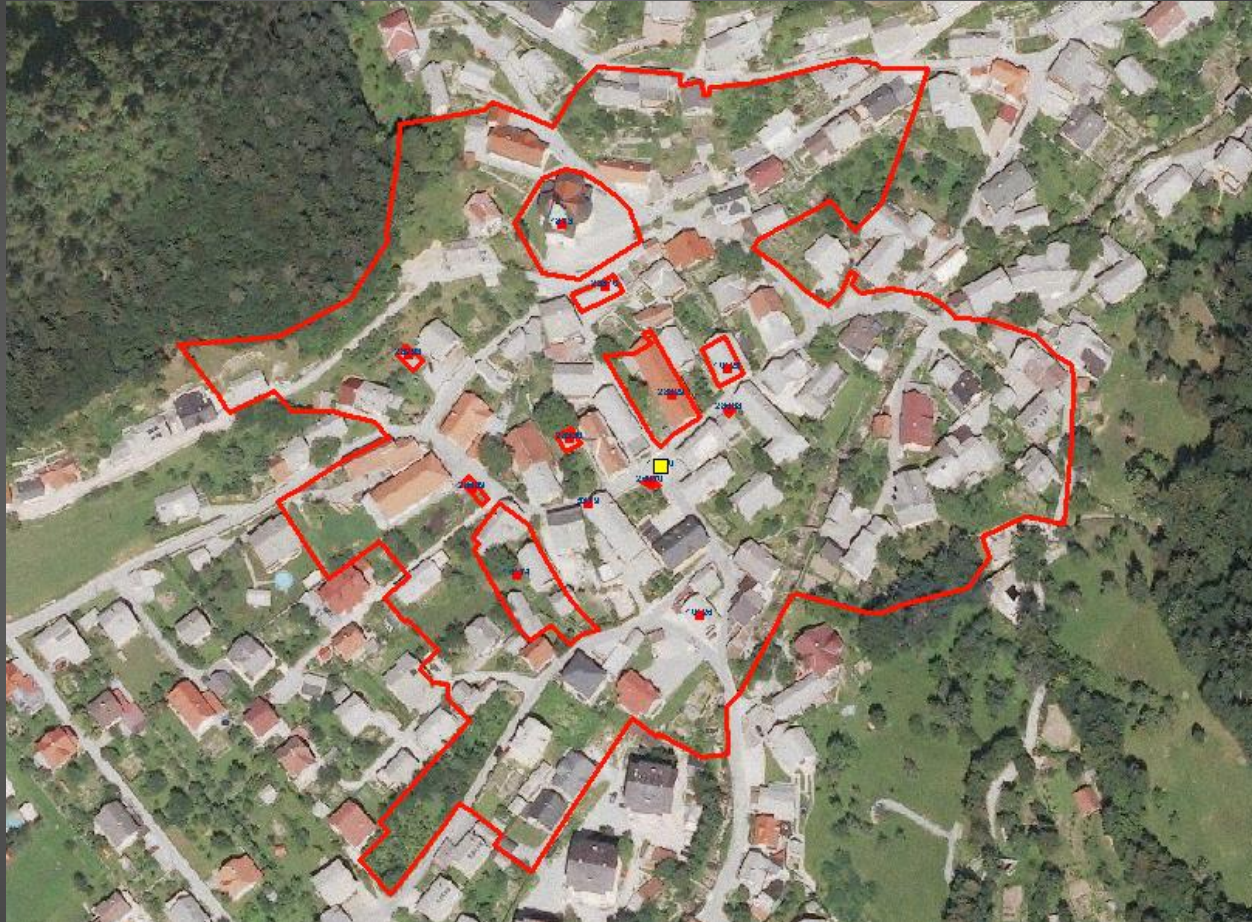
Območje Vaškega jedra Koroške Bele.

Gručasto vaško jedro z delom na ravnini in delom prislonjenim na pobočje vzpetine s cerkvijo. Ohranjena zasnova kmečkih hiš z gospodarskimi poslopji, znamenji, kapelicami in napajališči.