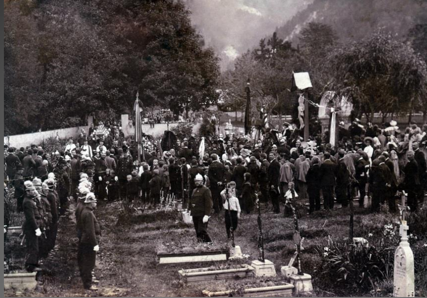
Pokopališče I. 1909.