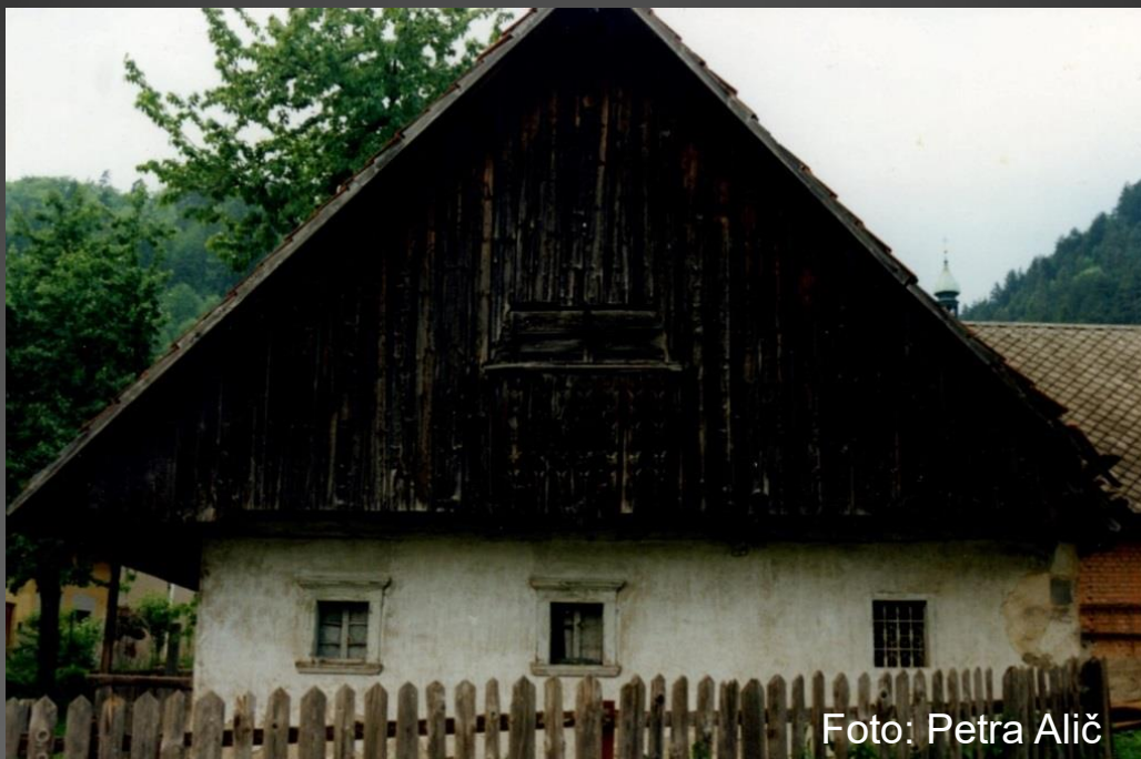
Maričnikova hiša, EŠD 10126, Potoška pot 2 (degradirana dediščina)