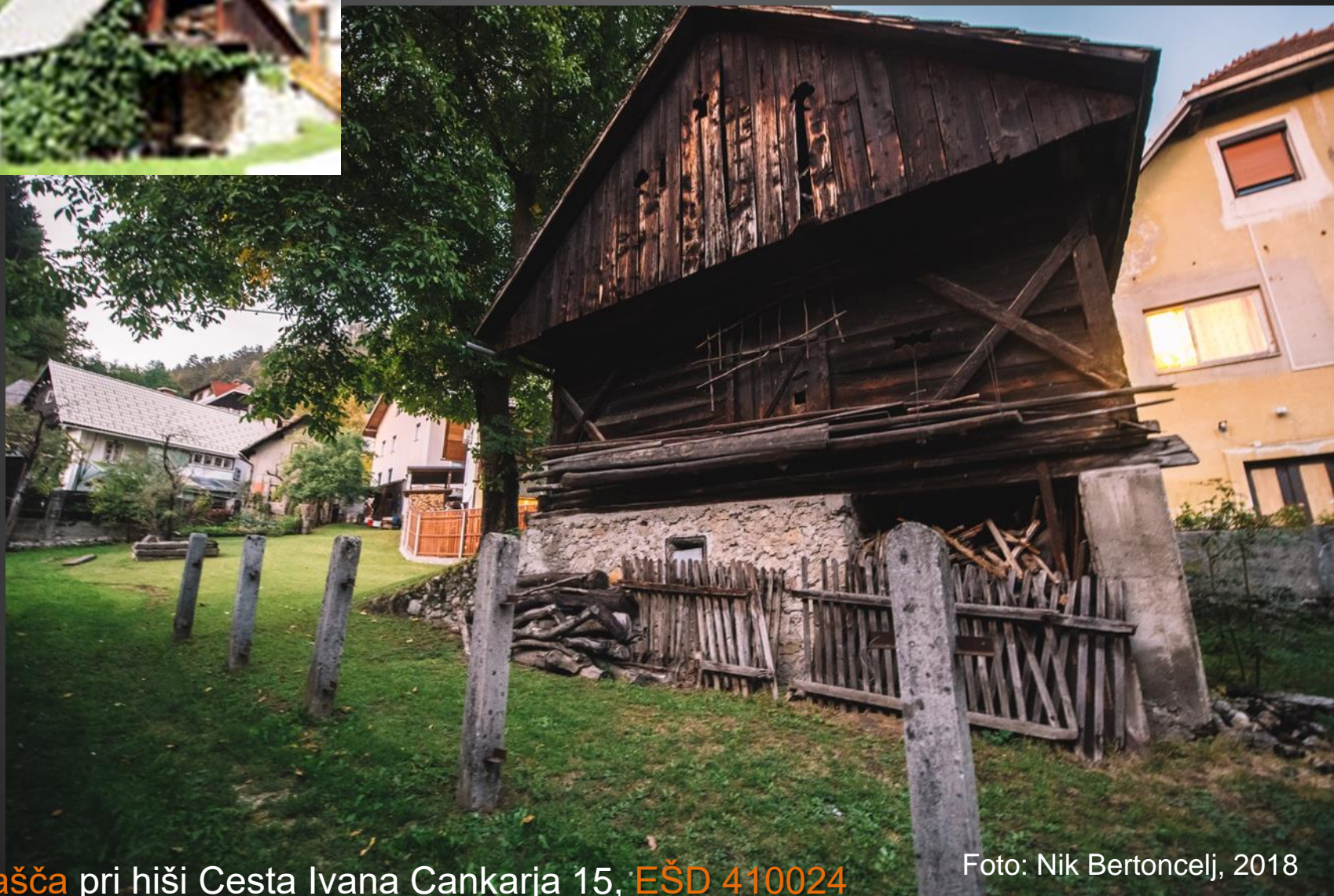
Kašča pri hiši Cesta Ivana Cankarja 15, EŠD 410024