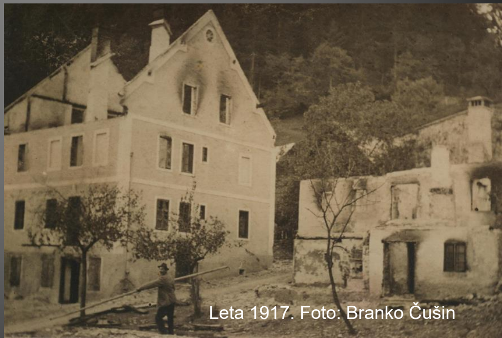
Leta 1917.