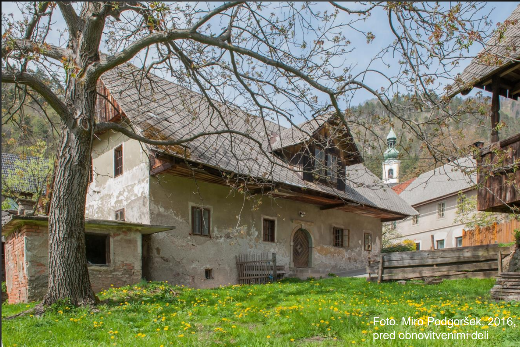
2016, pred obnovitvenimi deli