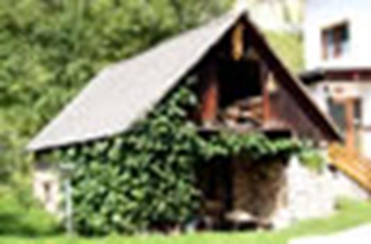
Levo: nekdanja sušilnica , EŠD 410025 na Koroška 1