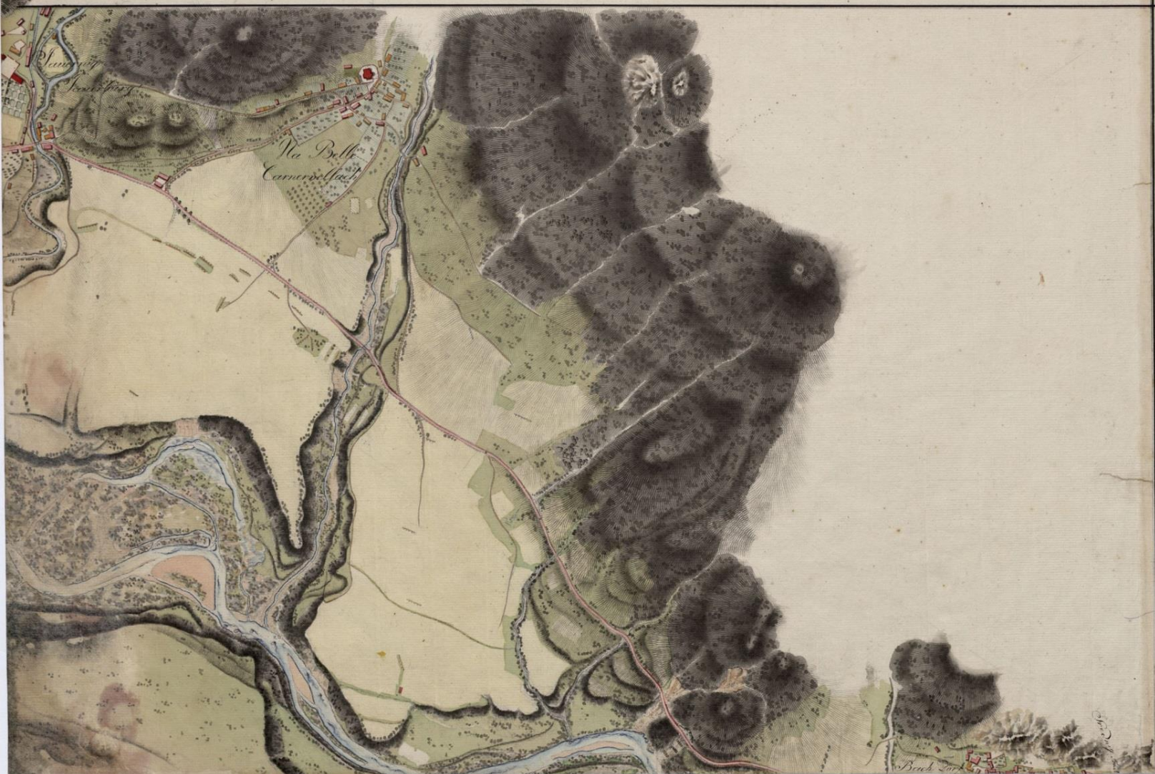
Poselitev Koroške Bele ok. leta 1807.