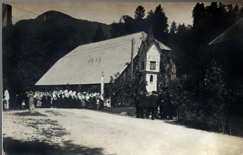
Štefančeva hiša in znamenje l. 1917.

Znamenje je datirano v leto 1812. Stoji JZ od starega vaškega jedra Koroške Bele, v križišču ceste Talcev in Cankarjeve. Slike in kipi v znamenju niso ohranjeni.