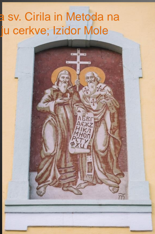
Freska sv. Cirila in Metoda na pročelju cerkve; Izidor Mole

Cerkev sv. Ingenuina in sv. Albuina na Koroški Beli, delo stavbenika Matije Perskyga, danes predstavlja primerek sakralne arhitekture druge polovice 18. stoletja, ki nam razodeva zanimivo združevanje tako avstrijskih baročnih stavbnih vzorcev kot tudi rimske baročne arhitekturne tradicije. Predhodnica današnje župnijske cerkve je bila sezidana leta 1361 v gotskem slogu in prav tako posvečena sv. Ingenuinu in sv. Albuinu. Leta 1754 je bila zaradi dotrajanosti porušena. Novo cerkveno stavbo je tik pred posvetitvijo leta 1761 zajel požar. Današnjo cerkev je tako šele čez deset let, 3. septembra 1771, posvetil ljubljanski škof Karel grof Herberstein. Notranjost krasijo oltarji in bogastvo stenskih poslikav različnih umetnostnozgodovinskih obdobj. Najbolj zanimive freske so iz prve polovice 20. stoletja. Nastale so izpod rok znanega slovenskega slikarja Mateja Sternena. Vir: GMJ